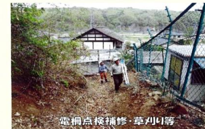
電柵点検補修・草刈り等