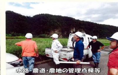
水路・農道・農地の管理点検等