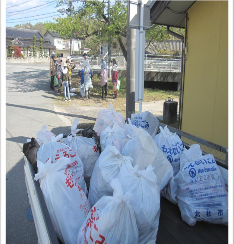
育成会との清掃活動