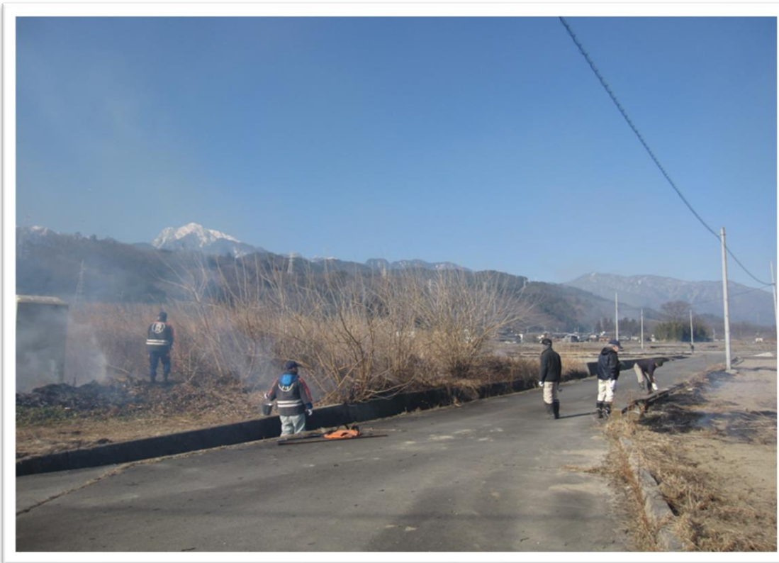
消防団協力による芝焼