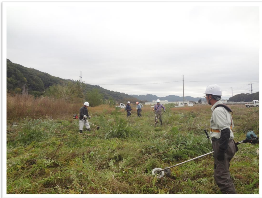
遊休農用地の解消