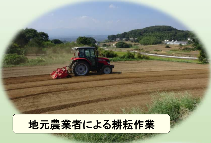
地元農業者による耕耘作業