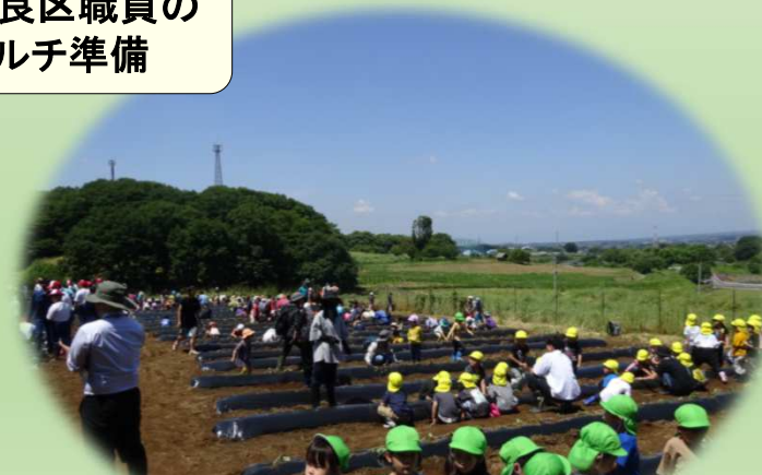
特別支援学校・こども園などによるサツマイモ植え