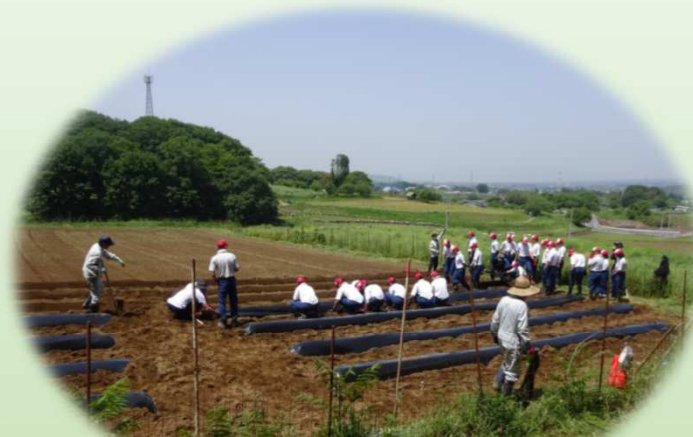
特別支援学校生徒と改良区職員の 共同サツマイモ畑マルチ準備