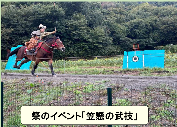
祭のイベント「笠懸の武技」