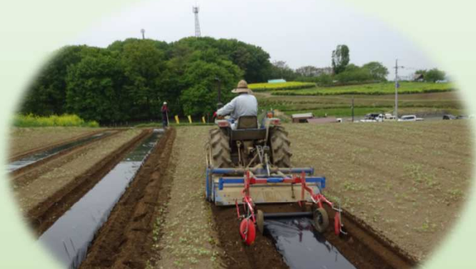
改良区職員による綿花畑マルチ準備