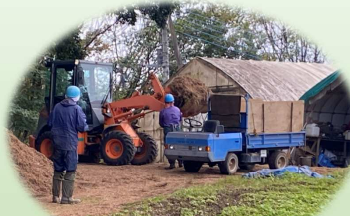
フットパス整備作業準備