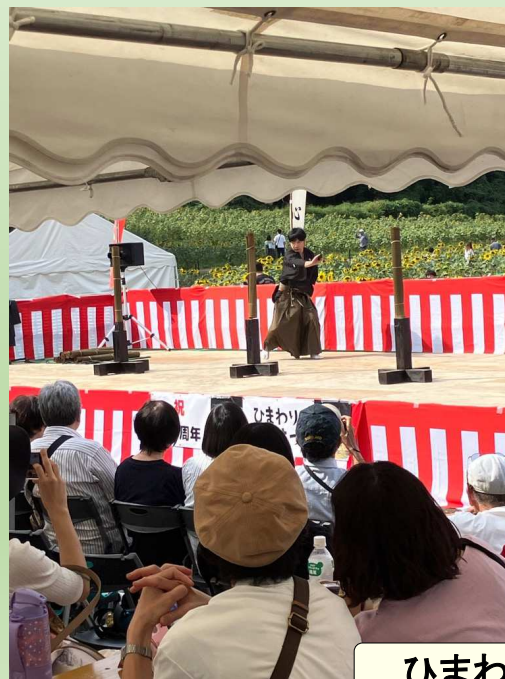
ひまわり祭り状況