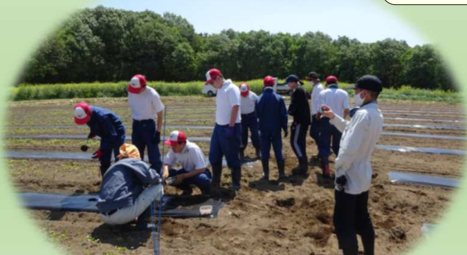
特別支援学校生徒と改良区職員の共同綿花播種