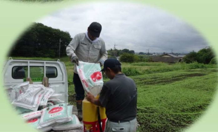
改良区職員による化成肥料等散布