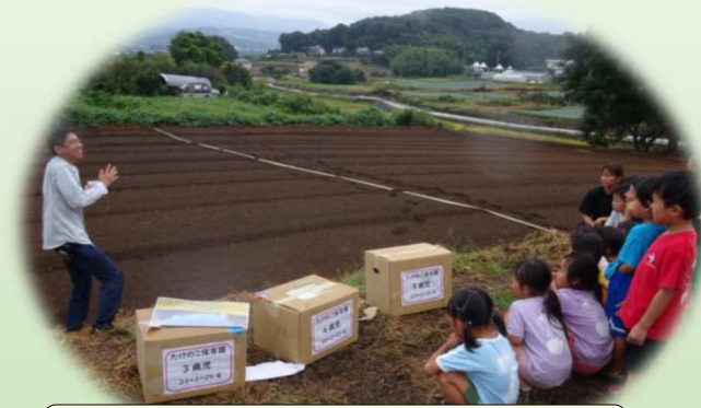
改良区職員による作業説明