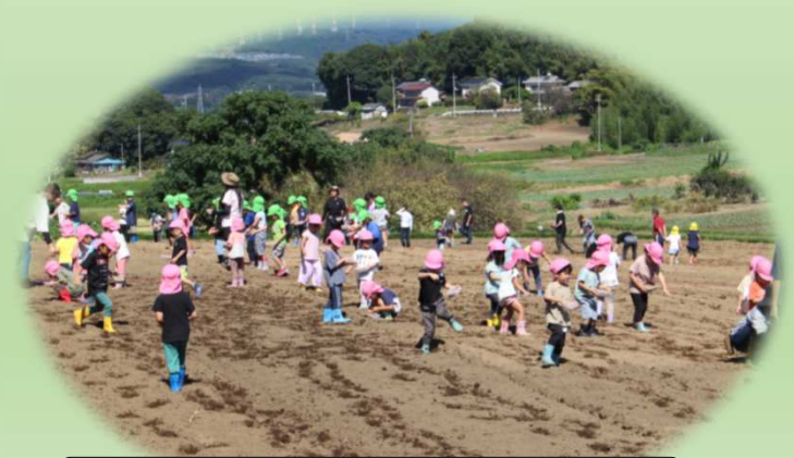
幼稚園児等による菜たね播き