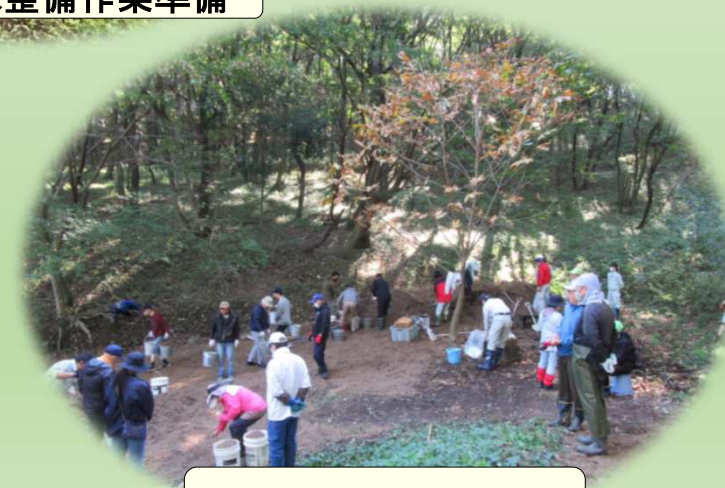
フットパス整備作業