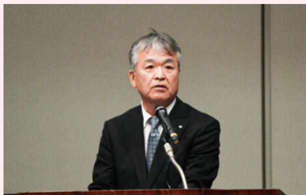
高田専務理事による要請書の朗読