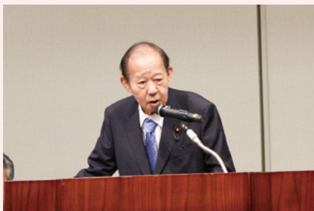
二階俊博 全国土地改良事業団体連合会会長挨拶