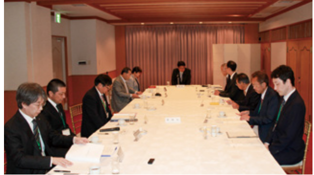
山梨県受益農地管理強化委員会