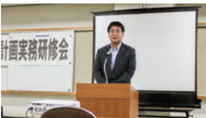
清水専務理事挨拶

午後からは、「土地改良法の概要及び換地のルールと手続き」と題して全土連中央換地センター小笠原所長より講義をいただきました。