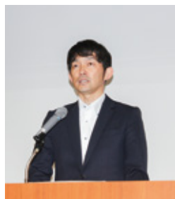
山梨県土地改良技術協議会 川口副会長