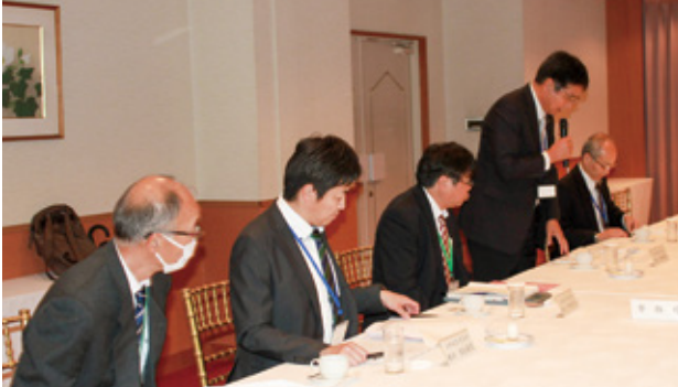
山梨県管理運営体制強化委員会