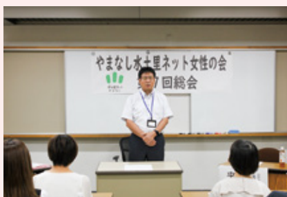
清水専務理事祝辞