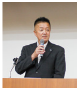
山梨県農政部 茂手木技監